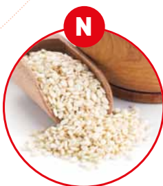
N SESAMSAMEN UND DARAUS GEWONNENE ERZEUGNISSE