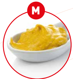
M SENF UND DARAUS GEWONNENE ERZEUGNISSE