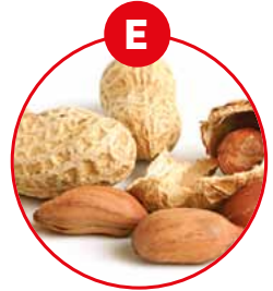
E ERDNÜSSE UND DARAUS GEWONNENE ERZEUGNISSE