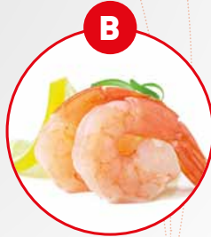
B KREBSTIERE UND DARAUS GEWONNENE ERZEUGNISSE