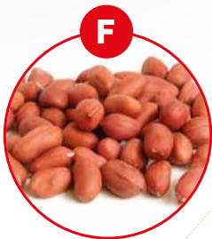
F SOJABOHNEN UND DARAUS GEWONNENE ERZEUGNISSE