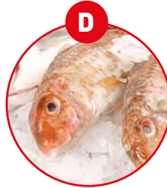
D FISCH UND DARAUS GEWONNENE ERZEUGNISSE (AUSSER FISCHGELATINE)