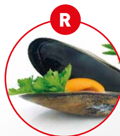
R WEICHTIERE WIE SCHNECKEN, MUSCHELN, TINTENFISCHE UND DARAUS GEWONNENE ERZEUGNISSE