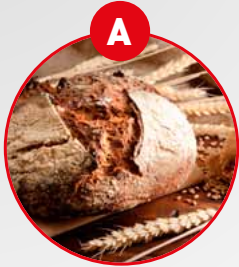
A GLUTENHALTIGES GETREIDE UND DARAUS GEWONNENE ERZEUGNISSE

Allergeninformation gemäß Codex-Empfehlung