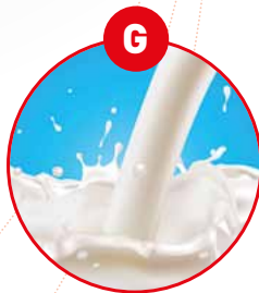
G MILCH VON SÄUGETIEREN UND MILCHER- ZEUGNISSE (INKLUSIVE LAKTOSE)