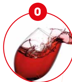
O SCHWEFELDIOXID UND SULFITE