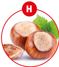
H SCHALENFRÜCHTE UND DARAUS GEWONNENE ERZEUGNISSE