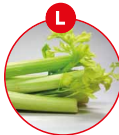
L SELLERIE UND DARAUS GEWONNENE ERZEUGNISSE